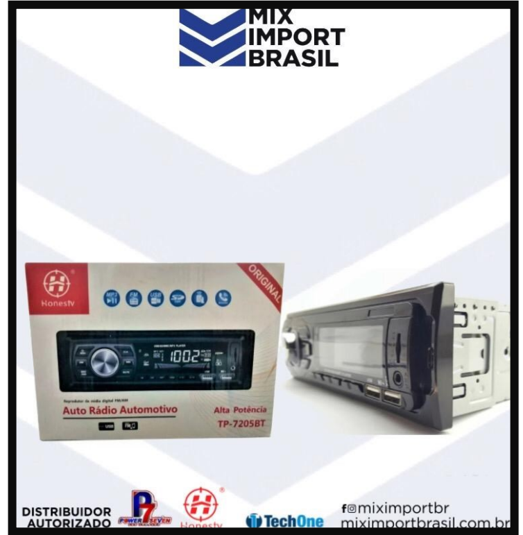
. RADIO COM BT E SEM BT