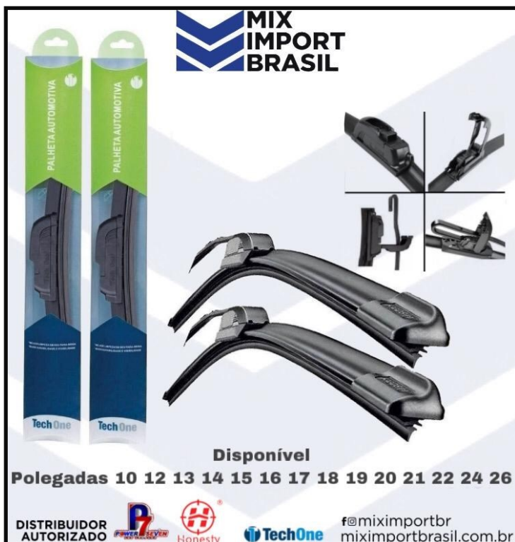
• PALHETA SOFT