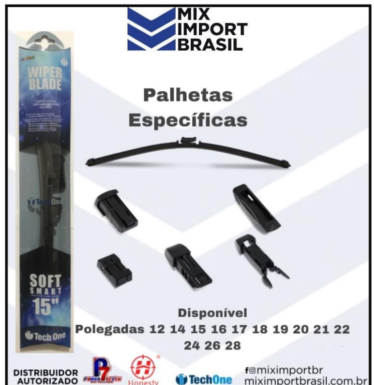
• PALHETA SMARTE