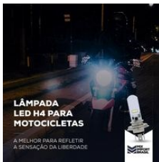
CATALOGO DE MOTO.pdf