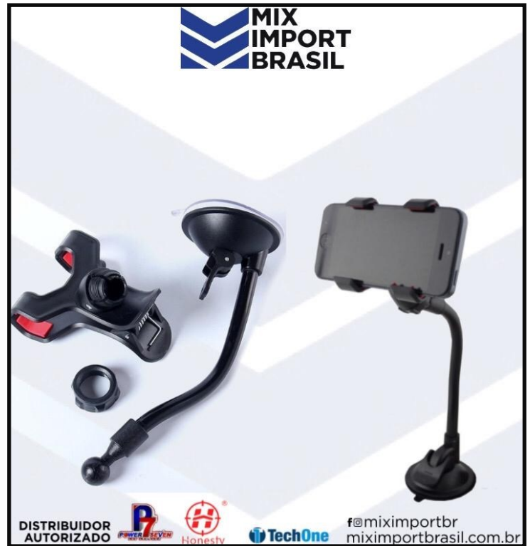
• SUPORTE DE CELULAR LE 016