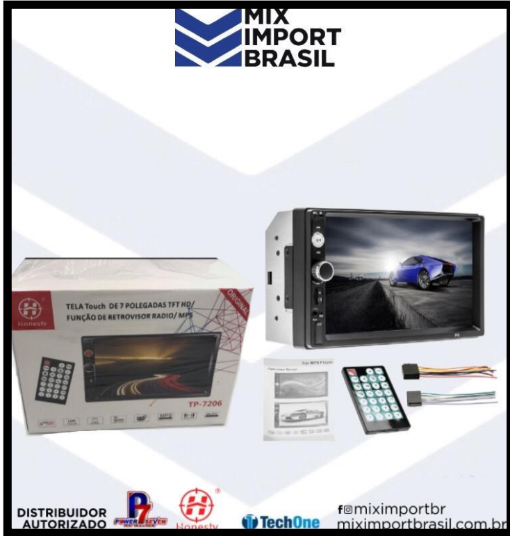
. KIT MUTIMIDIA