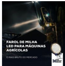
CATALOGO FAROL MIX.pdf