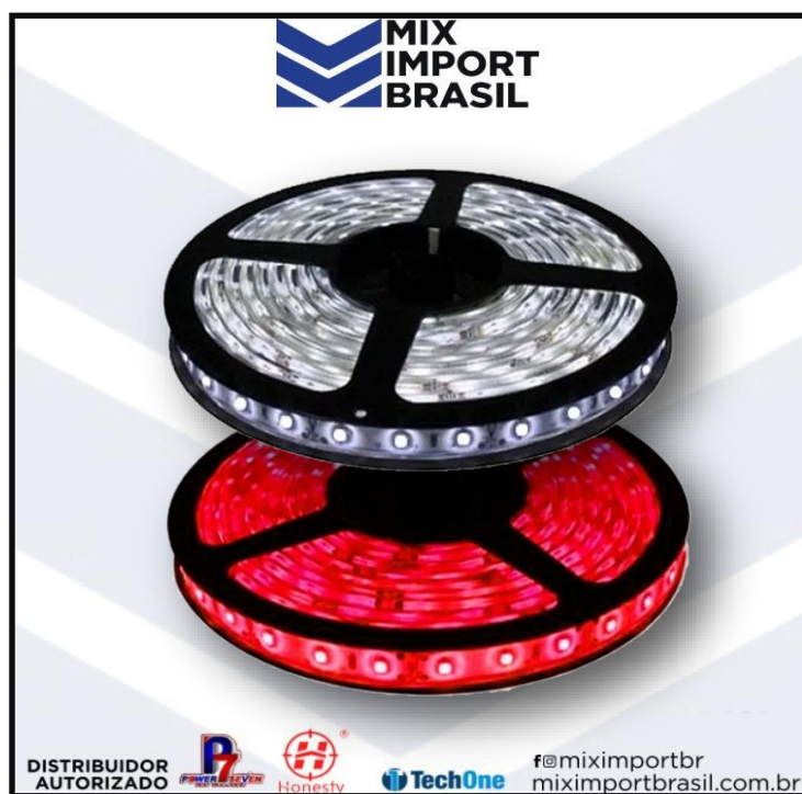
• FITA LED 5 MT VEMELHA 12V E 24V