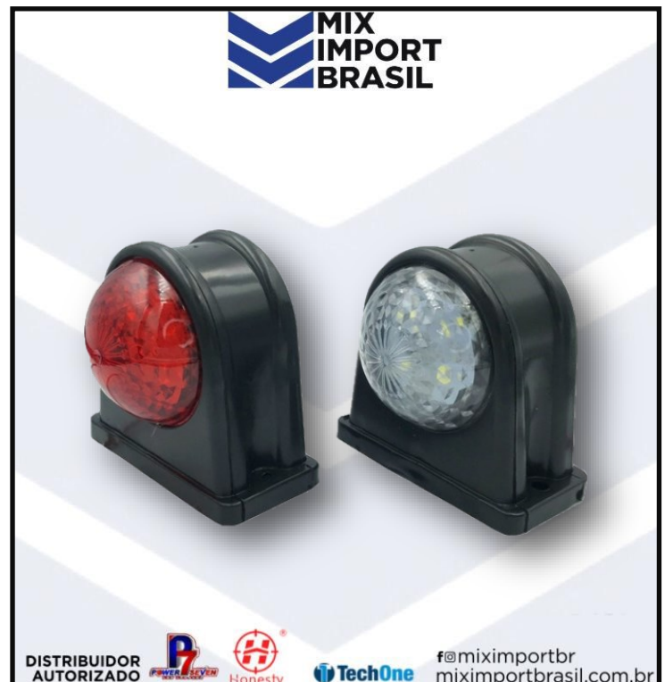
• LENTE LATERAL CHIFRINHO