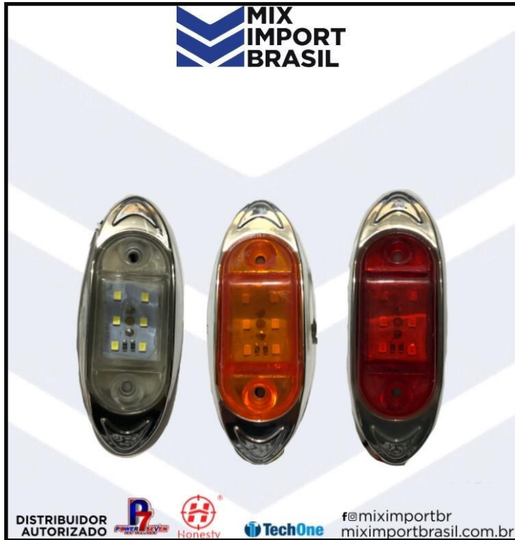
• PLACA 6 LED ACRILICA