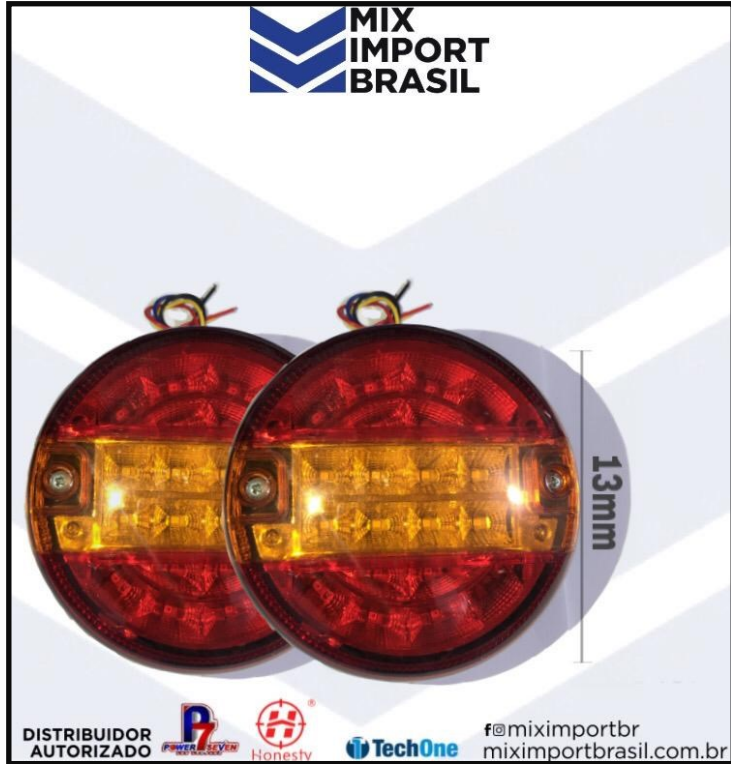
LANTERNA REDONDA TRASEIRA