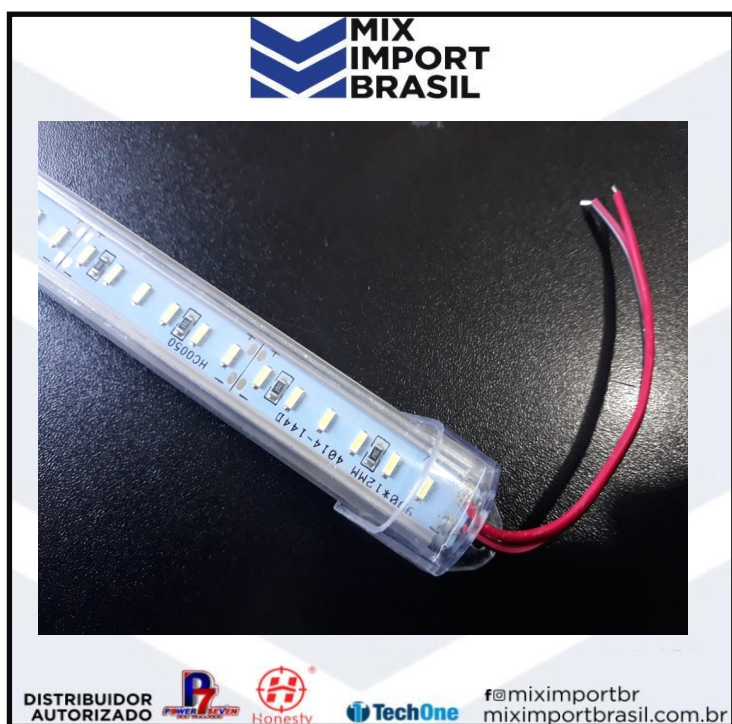
• TUBULAR 24V 1METRO