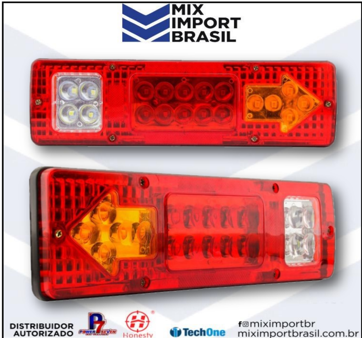
• LANTERNA CARRETINHA VERMELHA 12V