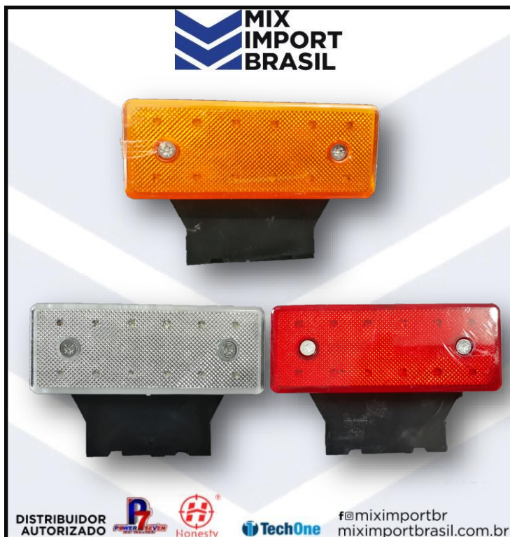
• PLACA LATERAL