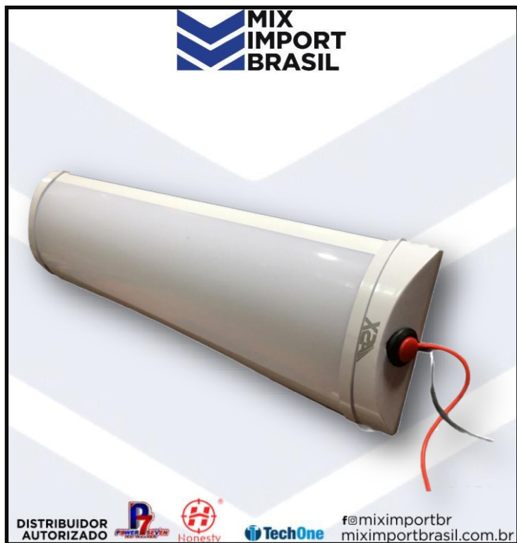
• LUMINARIA 72 LED BIVOLTE