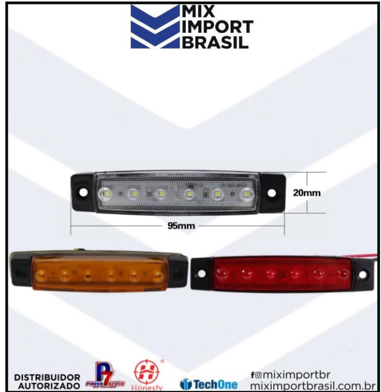
• PLACA 6 LED