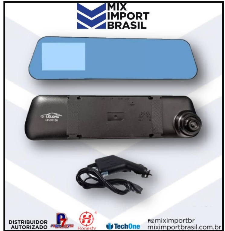
• GRAVADOR DE CONDUCAO