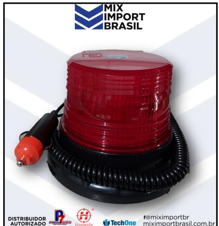
• GIROLED 72 LED VERMELHO 12V/24V