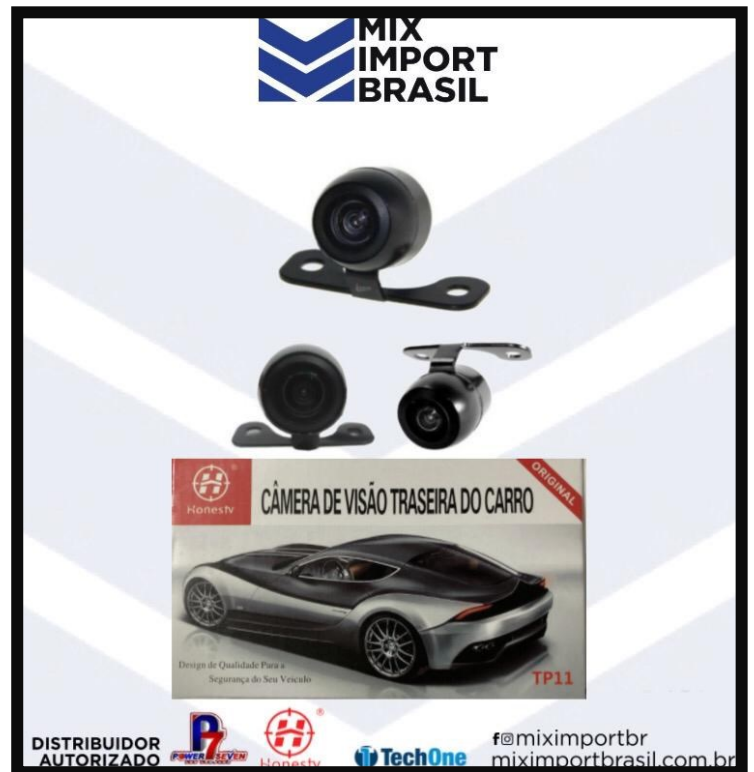
. CAMERA DE RE