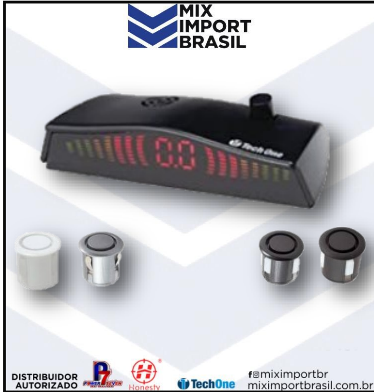
• SENSOR DE ESTACIONAMENTO PADRAO