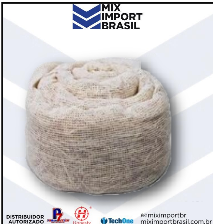
• REFIL DE PALHA