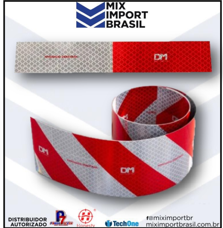
• FAIXA REFRETIVA