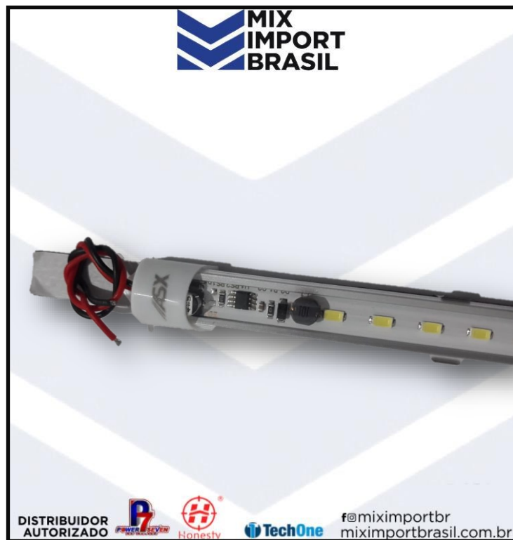
• TUBULAR 50CM BIVOLTE