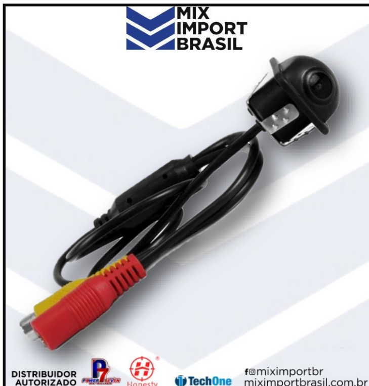
• CAMERA DE RE TARTARUGA