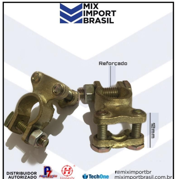
• TERMINAL DE BATERIA