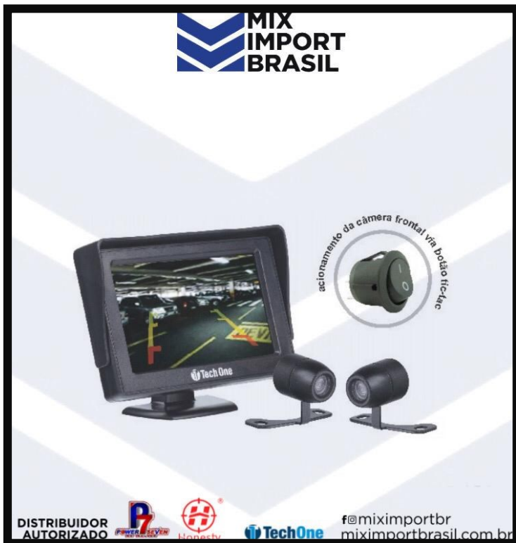
. KIT MUNITOR