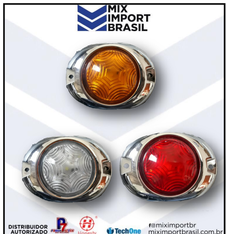
• LANTERNA TARTARUGA