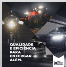
LAMPADA COMUM (CATALOGO).pdf