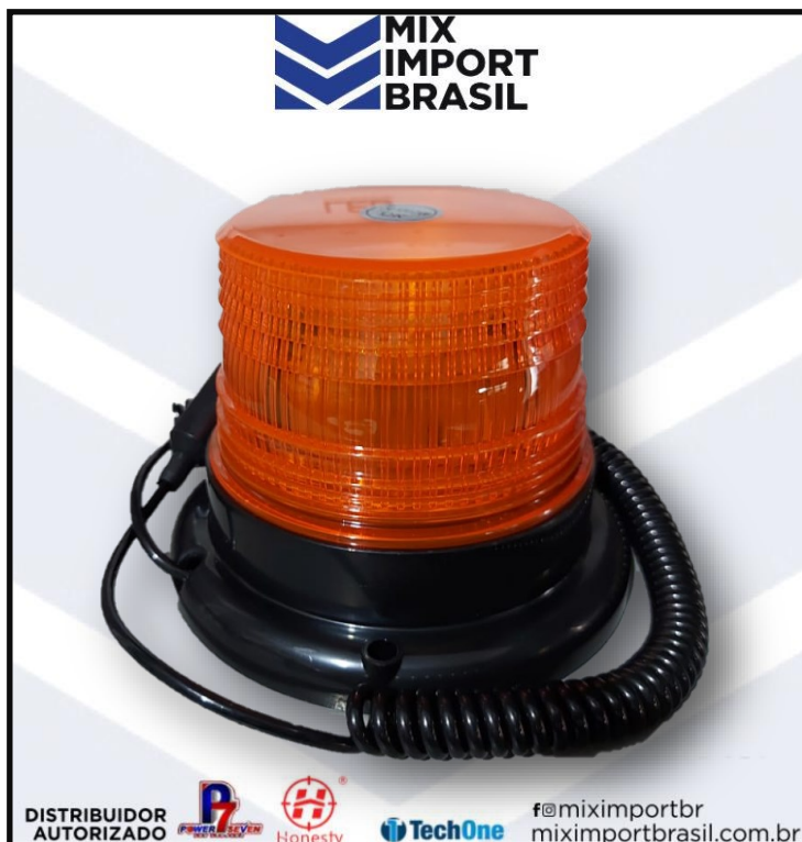
• GIROLED 72 LED AMARELO 12V/24V