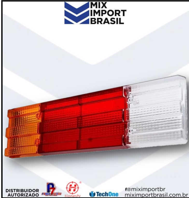
• LENTE MERCEDES