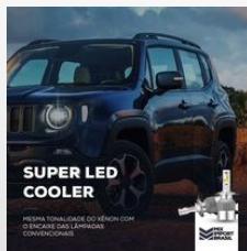
KIT DE LED.pdf