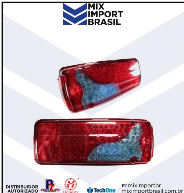
• LANTERNA SCANIA