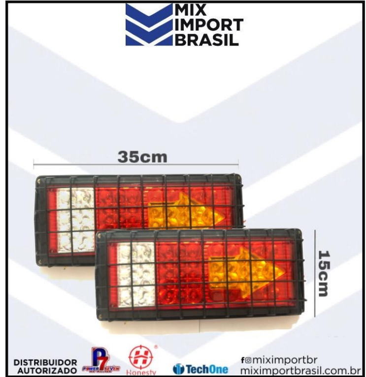
• LANTERNA GRADE