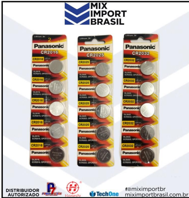
• PILHA 2032 , 2025 , 2016