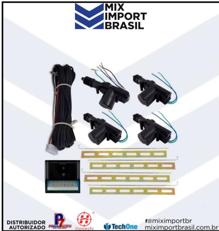
• TRAVA ELETRICA 4 PORTA